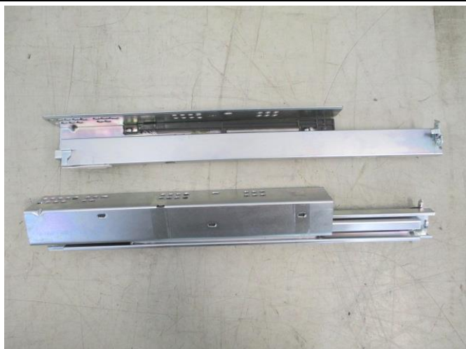
Pic. 1: Overview (unextended)